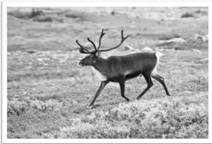
Rendier in het Kebnekaisedal in Lapland, Zweden

“Ja”, zei de andere partij, “maar hij heeft het nog nooit andersom geprobeerd.”