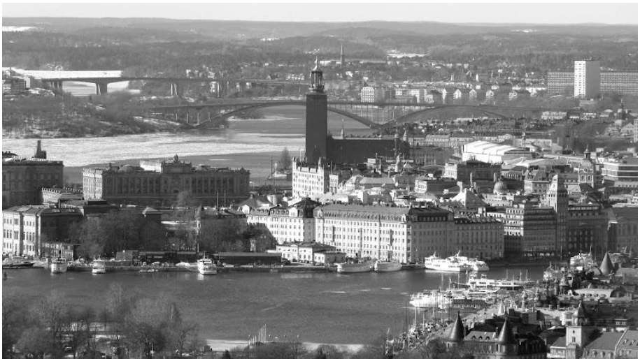
Uitzicht over Stockholm vanaf 'Käknästornet'

Verenigingsblad van de Scandinavische Vereniging Groningen